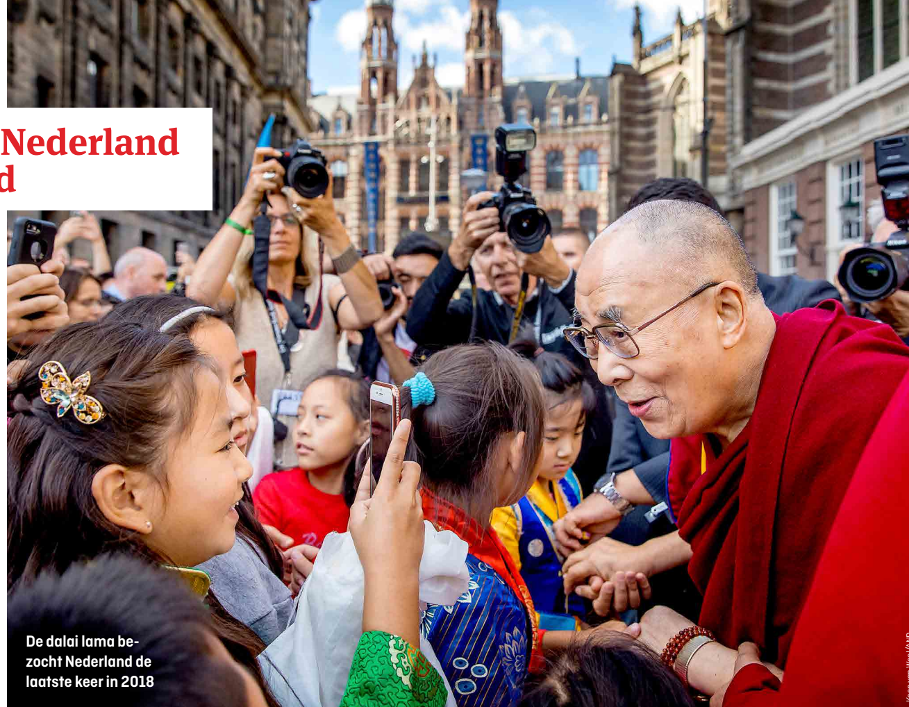
De dalai lama bezocht Nederland de laatste keer in 2018

'De boeddhistische religie is de ruggraat van onze cultuur en identiteit. Op 6 juli vieren we de verjaardag van de dalai lama. In het kader van het Tibetaanse Nieuwjaar is er elk jaar een groot feest in een partycentrum bij station Sloterdijk in Amsterdam. Daar komt iedereen. Na de