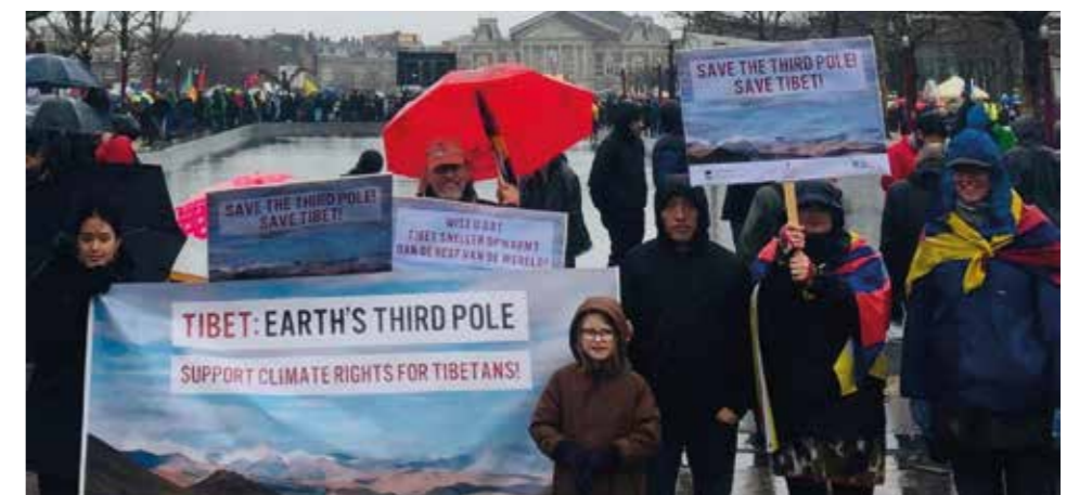
ICT Actieteam tijdens klimaatmars, Amsterdam 10 maart 2019

taanse nomaden, van oudsher de hoeders van Tibets fragiele ecosysteem, verdreven naar troosteloze betonnen woonblokken, in plaats van hun waardevolle kennis in te zetten