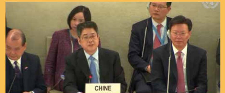
Chinese delegatie bij de VN-mensenrechtenraad in Genève, maart 2019

Het gedrag van China toont aan dat het land nog steeds niet van plan is het VN-mensenrechtenconvenant na te leven.