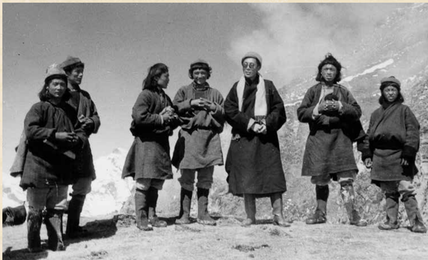
De Dalai Lama (3.v.r.) tijdens zijn vlucht naar India in maart 1959

10 maart 1959 is een bijzonder dramatische datum in de Tibetaanse geschiedenis. Het begin van de Tibetaanse volksopstand was eveneens het startschot voor de vlucht van de Dalai Lama, samen met tienduizenden Tibetanen, en voor de wederopbouw van de Tibetaanse gemeenschap in ballingschap.