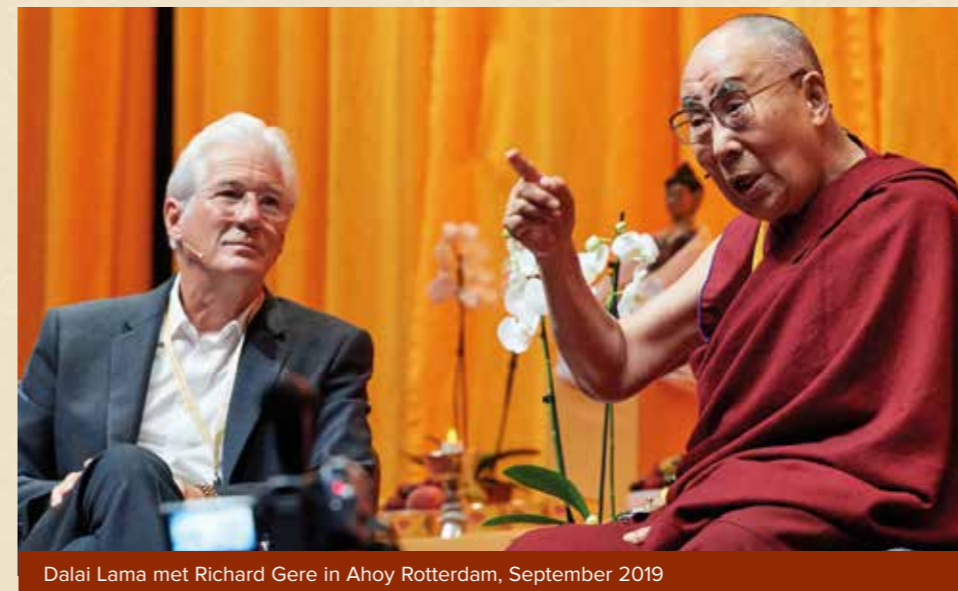
Dalai Lama met Richard Gere in Ahoy Rotterdam, September 2019

Vanaf dat moment is de Dalai Lama alleen nog de geestelijk leider van de Tibetanen en worden Tibetanen geregeerd door een democratisch gekozen parlement en president.