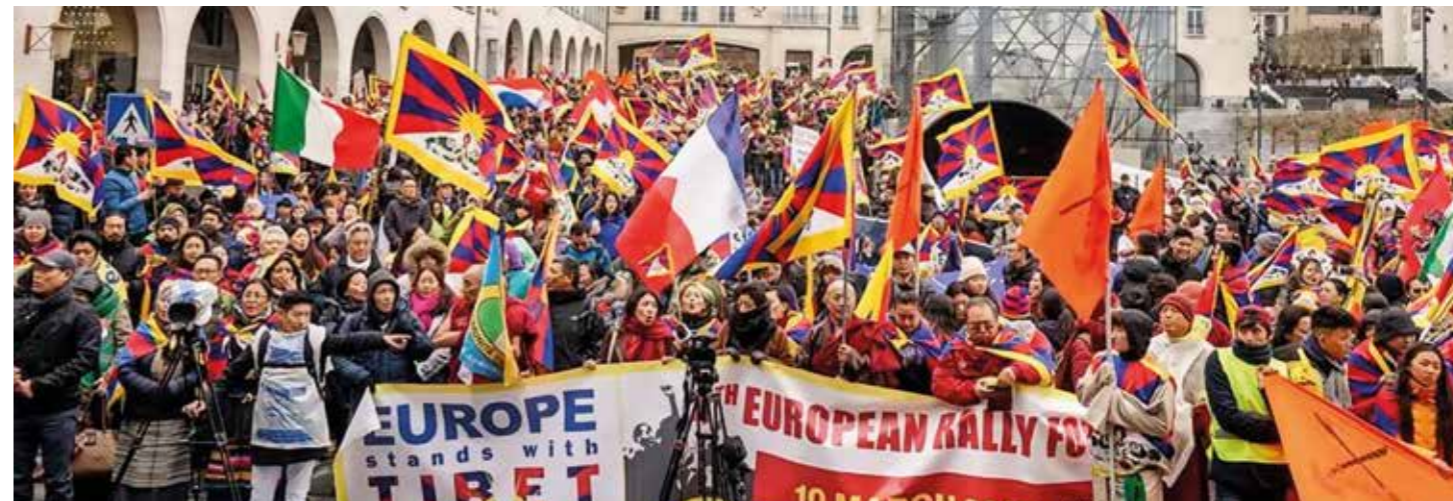
Europese Solidariteitsmars voor Tibet in Brussel, 10 maart 2019

Ter gelegenheid van de 60ste herdenkingsdag van de Tibetaanse nationale opstand kwamen op 10 maart ongeveer 3.500 Tibetanen en Tibet-aanhangers uit heel Europa bijeen in Brussel voor de 4de Europese Solidariteitsmars voor Tibet.