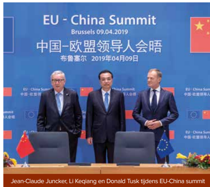
Jean-Claude Juncker, Li Keqiang en Donald Tusk tijdens EU-China summit

Voorzitter van de Europese Raad Donald Tusk verzekerde dat hij de mensenrechten en een aantal individuele gevallen bij Li had aangekaart. Het algemene en weinig concrete resultaat maakt de vraag acuut in welke mate de EU mensenrechten wil laten meewegen in haar economische betrekkingen.