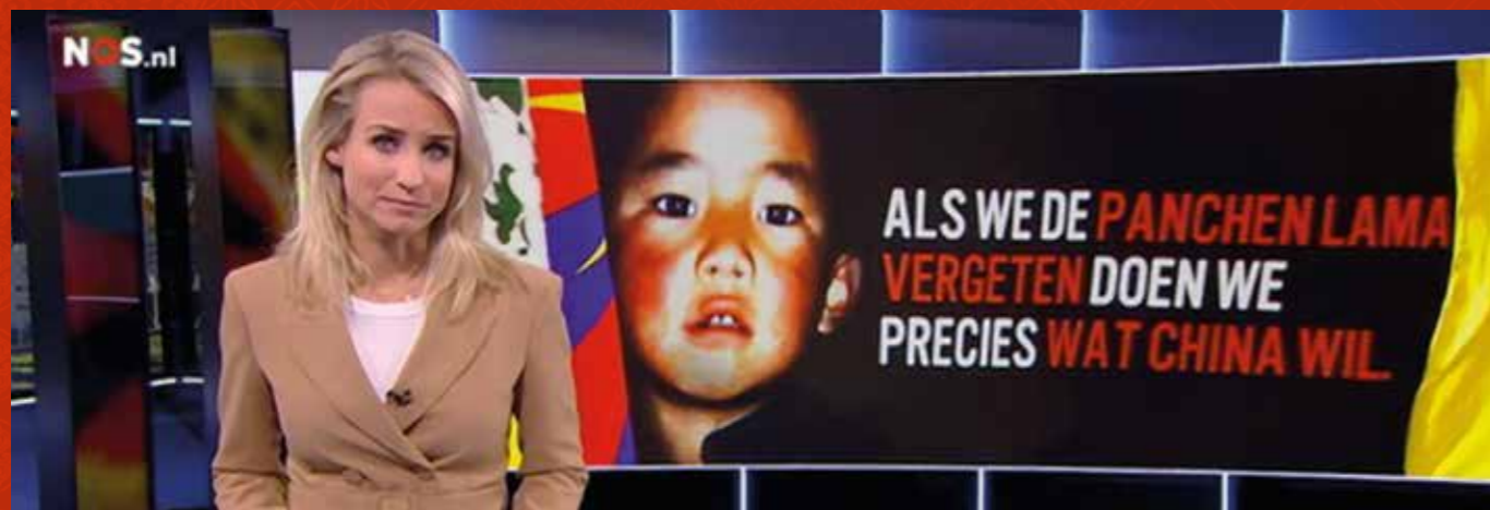
ICT Panchen Lama actie in NOS Journaal, 25 april 2019

In Nederland organiseerde ICT een demonstratie bij de Chinese ambassade in Den Haag en bood een petitie aan gericht aan Xi Jinping, waarin ICT aandrong op zijn onmiddellijke vrijlating. Om politieke redenen ontvoerden de Chinese autoriteiten in 1996 de destijds 6-jarige door de Dalai Lama erkende Panchen Lama en sindsdien weigeren ze informatie te verstrekken over zijn verblijfplaats, ondanks herhaalde verzoeken van de VN. Het NOS Journaal besteedde uitgebreid aandacht aan de actie bij de ambassade.