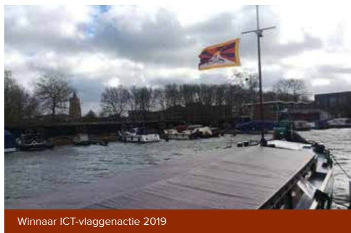
Winnaar ICT-vlaggenactie 2019