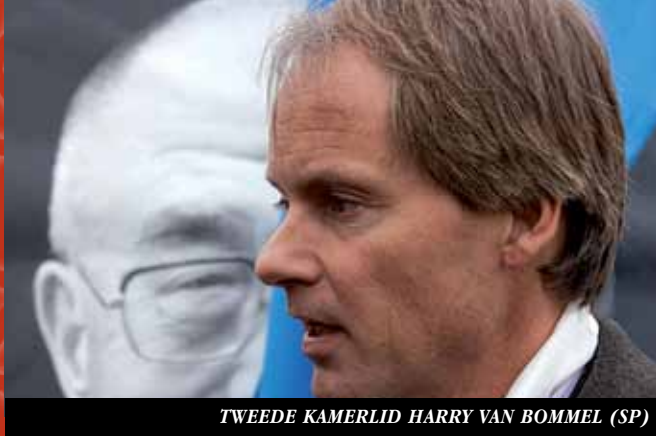
TWEDE KAMERLID HARRY VAN BOMMEL (SP)

Op verzoek van de Chinese ambassade vond er op 31 maart 2011 een ontmoeting plaats tussen de vaste commissie voor Buitenlandse Zaken en een Chinese delegatie, met als doel de volksvertegenwoordigers te informeren over de recente ontwikkelingen in Tibet. International Campaign for Tibet (ICT) voorzag de commissie van actuele informatie over de situatie in Tibet.