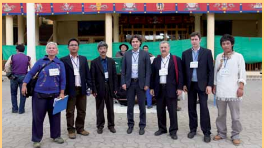
INPAT LEDEN IN DHARAMSALA, 20 MAART 2011

Aanbevelingen van de missie betroffen: het invoeren van wetgeving