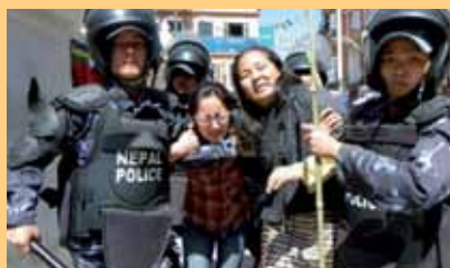
NEPALESE POILTIE OP 10 MAART, KATHMANDU

nemen. Het handhaven van het gentlemen's agreement over Tibetaanse vluchtelingen, tussen Nepal en de VN Hoge Commissaris voor de Vluchtelingen, is volgens het Europees Parlement van essentieel belang. De Nepalese autoriteiten moeten niet toegeven aan de Chinese druk op Nepal en afzien van preventieve arrestaties en restricties op demonstraties. Het Europees Parlement roept de EU op om aandacht te schenken aan de situatie van de Tibetaanse vluchtelingen in Nepal.