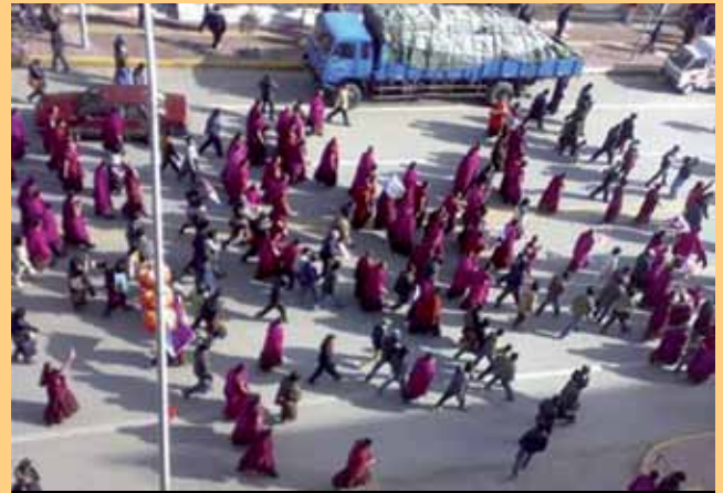
MONNIKEN PROTESTEREN OP STRAAT, LABRANG 2008

De Chinese regering hanteert een rigoreus religieus beleid in Tibet. Tibetaans boeddhisme is een onlosmakelijk element van de Tibetaanse identiteit. Om die reden wordt het boeddhisme gezien als bedreiging voor de eenheid van China. In tegenstelling tot hetgeen de Chinese Communistische Partij de wereld probeert te laten geloven, is vrijheid van religie in Tibet verre van werkelijkheid. De Chinese Communistische Partij heeft haar controlemechanismen in religieuze instituties in Tibet versterkt. Zo hanteert China sinds 2007 een wet waarbij nieuwe incarnaties van bekende lama's moeten worden goedgekeurd door de Communistische Partij.