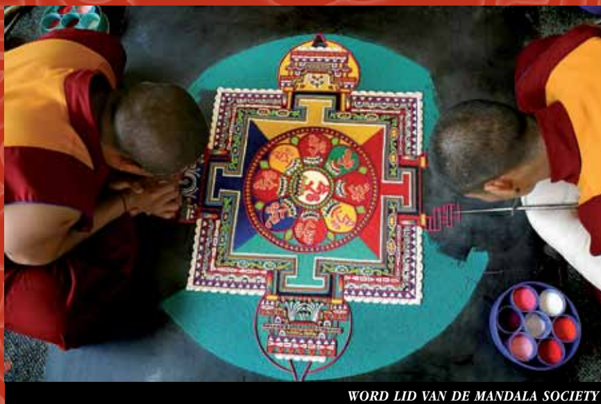
WORD LID VAN DE MANDALA SOCIETY

De Mandala Society is in het leven geroepen in 2007 voor donateurs die ICT in hun testament willen opnemen.