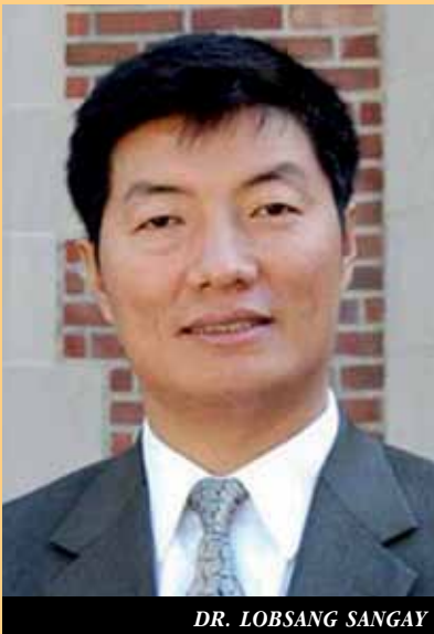
DR. LOBSANG SANGAY

Op 27 april 2011 maakte de verkiezingscommissie de resultaten van de Tibetaanse verkiezingen in ballingschap bekend. Lobsang Sangay werd gekozen als nieuwe premier, de Kalon Tripa.