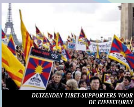
DUIZENDEN TIBET-SUPPORTERS VOOR DE EIFFELTOREN

Op 15 april kwam het Tibetaanse Nationale Voetbalelftal in Nederland aan voor een door ICT georganiseerde Europese Tour van vijf weken. Het team speelde wedstrijden in Nederland en in Zwit-