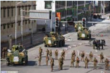
CHINESE VEILIGHEIDSTROPEN IN DE STRATEN VAN LHASA

Tibet april 2008. Nomaden te paard galopperen naar een stad; er is een monnik zichtbaar, die met zijn vuist zwaait en roept: 'Wij willen dat de Dalai Lama naar Tibet terugkeert!' De menigte rond hem ondersteunt hem luid. De vage beelden verdwijnen, en wij zien Tibetanen die een rode Chinese vlag neerhalen en de verboden Tibetaanse vlag met de sneeuwleeuwen hijsen.