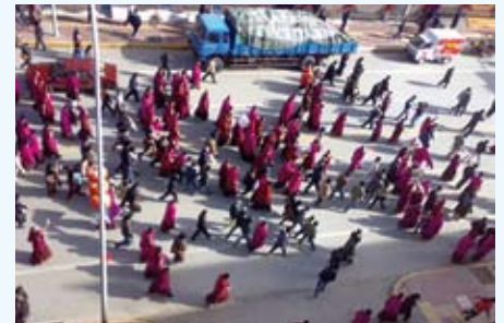
PROTESTEN BIJ HET LABRANG KLOOSTER, 14 MAART 2008

weten niet of zij in leven zijn of dood. Honderden Tibetanen uit Lhasa, onder wie veel monniken, werden naar de nieuwe trein naar Qinghai vervoerd. Ooggetuigen zagen dat Tibetanen in Lhasa naar het station werden gebracht door gewapende troepen, terwijl anderen rapporteerden dat er groepen in Xining, Qinghai, aankwamen. Een ooggetuige vertelde: 'Alle gevangenen schenen ernstig gewond te zijn en sommigen hadden bloed op hun gezicht. Een oudere vrouw met zware ketens aan haar voeten, en zonder schoenen, werd door politie geslagen.' Een paar weken geleden werden de lichamen van drie kinderen die in de rug waren geschoten, weggehaald bij hun families in Lhasa terwijl er gebeden werden opgezegd.