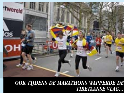
OOK TIJDENS DE MARATHONS WAPPERDE DE TIBETAANSE VLAG...

Centrum een grote manifestatie op de Dam in Amsterdam met een eigen bijdrage van iedere organisatie. Tijdens deze manifestatie vragen we premier Balkenende om de Dalai Lama uit te nodigen in Den Haag om zijn visie uiteen te zetten op de vreedzame oplossing van de situatie in Tibet. Op deze dag wordt er een grote Muur van de Vrijheid gebouwd. ICT-leden en anderen sturen persoonlijke Vrijheidsfakels en Boodschappen van Solidariteit met de Dalai Lama op die een plaatsje krijgen op de Muur.