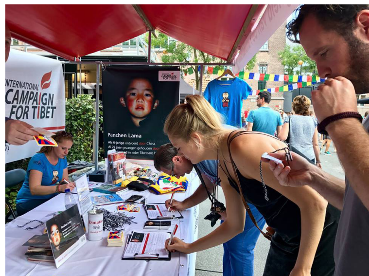
ICT mobiliseert steunbetuigingen tijdens het Umami Food Festival, Amsterdam