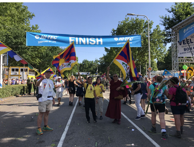
ICT vraagt aandacht voor de Tibetkwestie tijdens de Nijmeegse Vierdaagse

Het mobiliseren en betrekken van het maatschappelijk middenveld, de media en het grote publiek en hen tot actie te bewegen.