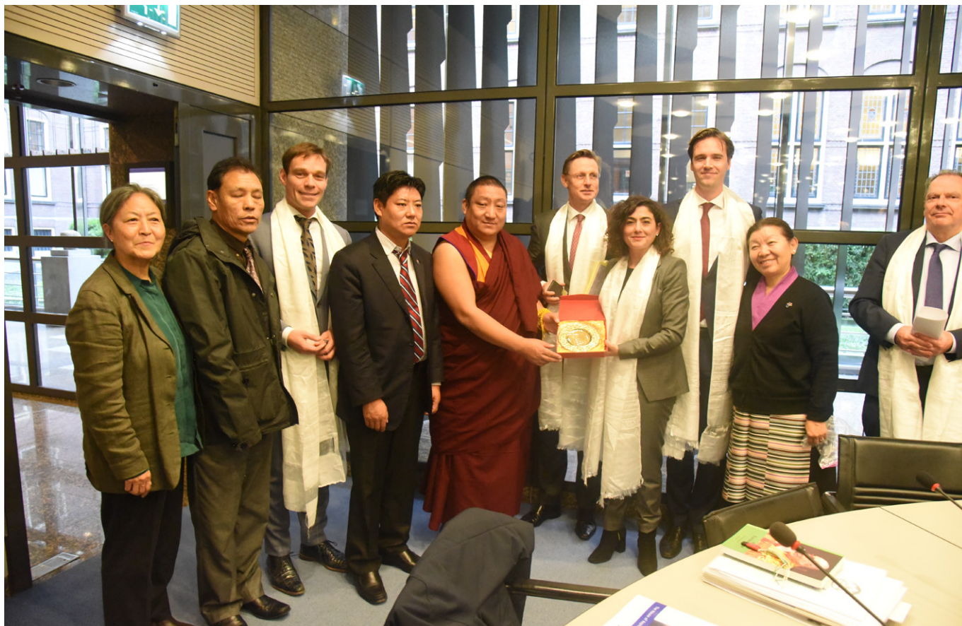
ICT's directeur en Tibetaanse parlementsleden ontmoeten Nederlandse Tweede Kamerleden in Den Haag

Bekrachtigen en activeren van Tibetanen in de Tibetaanse beweging en hun Tibetaanse gemeenschap.