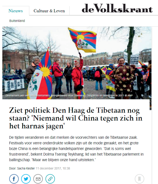
Interview met ICT in de Volkskrant

Effectief communiceren van ICT's standpunten en doelstellingen naar de regering, media, NGO's en het algemene publiek.