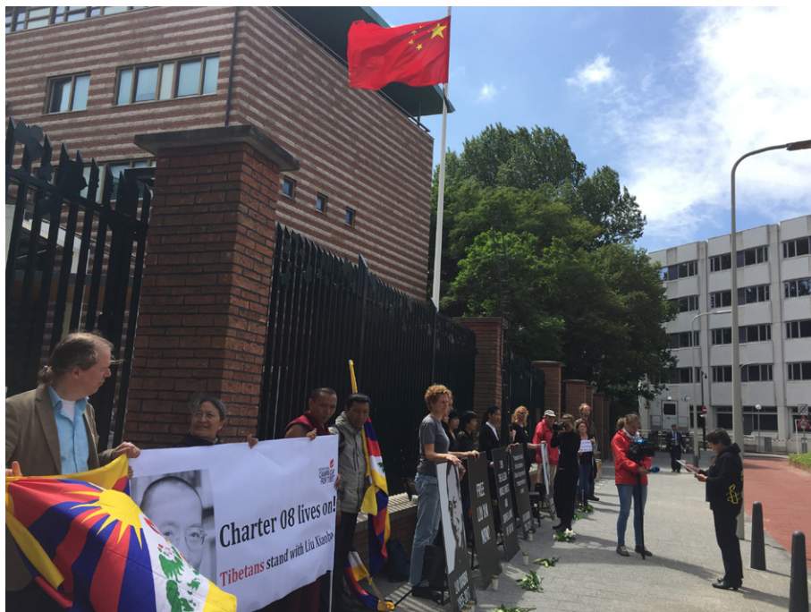
ICT neemt deel aan de herdenking na Liu Xiaobo overlijden, georganiseerd door Amnesty International, Chinese Ambassade, Den Haag

Versterken en uitbreiden van strategische partnerschappen en relaties om de verwezenlijking van ICT's missie te optimaliseren.