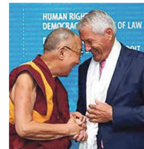
● Dalai Lama en Thorbjørn Jagland

Ondanks Chinese druk op het Europees Parlement om ontmoetingen met de Dalai Lama te annuleren, voerden de voorzitter van het Europees Parlement, Martin Schulz, en leden van de Commissie voor Buitenlandse Zaken in september in Straatsburg gesprekken met de Dalai Lama.