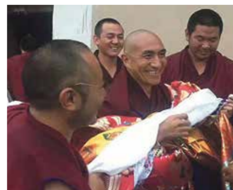
● Jamyang Phuntsok, Zat vast van 2009 tot 3 september 2016

Samen met u voert ICT actie voor de vrijlating van Tibetaanse politieke gevangenen in Tibet. Dankzij onze inzet zijn tussen april en september van dit jaar, acht Tibetanen vrijgelaten. Namens hen, dankt ICT u voor uw steun.