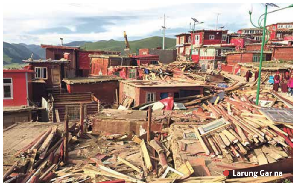
Larung Gar na