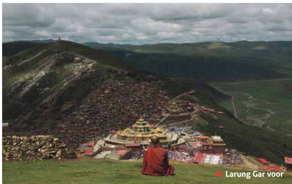
Larung Gar voor