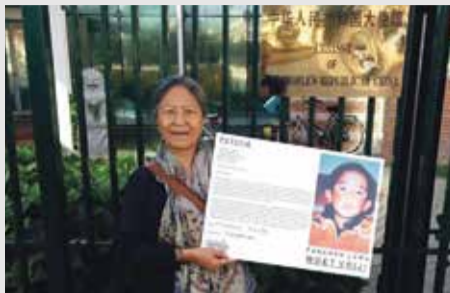
● Panchen Lama 21 jaar vermist

17 augustus, Barneveld, honderd Tibetanen en supporters verwelkomden 's werelds grootste Tibet-luchtballon bedrukt met de Tibetvlag tijdens de jaarlijkse Ballonfiesta. In Tibet is de Tibetvlag verboden. De Tibet-luchtballon trok veel publiciteit.