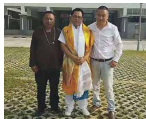
● Sangga, Zat vast van 2008 tot 13 augustus 2016