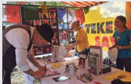
● ICT infostand

30 juli, Groningen, ICT's actieteam voerde actie in hartje Groningen over het lot van Tibetaanse schrijvers in de Chinese gevangenis. Duizenden mensen ondertekenden de petitie 'China, stop vervolging Tibetaanse schrijvers' in de afgelopen periode.